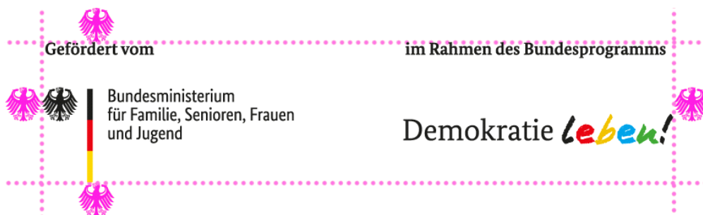
Illustration: Schutzraum um das Logo